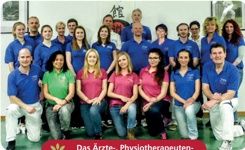
Das Ärzte-, Physiotherapeuten- und Trainerteam freut sich auf Sie