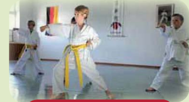
Kampfkunst & Tanzschule für jedes Alter