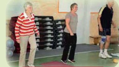
Bewegung und Spaß in unseren Kursen